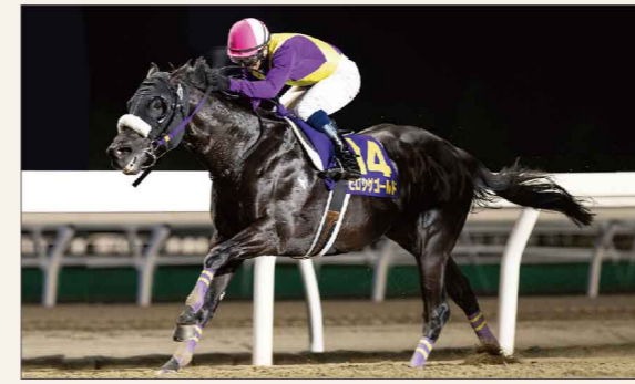
ヒロシゲゴールド

コスモビューティーでは2018年より、競走馬のブリーダー事業を開始しています。2021年に2頭が誕生、また2022年にさらに2頭誕生予定です。ブリーダーとして強い競走馬を育てていくべく、活動しております。