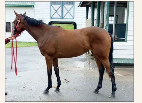
ディーブクイーン(父 ディーブインパクト) ※2022年デビュー予定