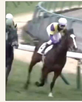
ヒロシゲダンディ