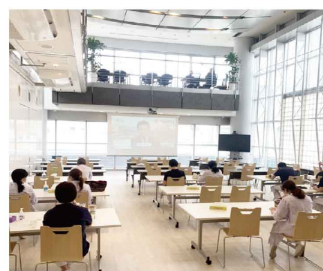
会議もできるようにスクリーンも完備