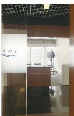
② 10階のエントランス この奥に会議室があります。