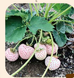
去年のホワイトベリーとラベンダー