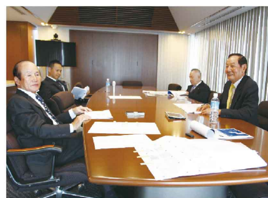
① 役員会議室 この写真は70周年を振り返った座談会の様子です。

10階は、役員会議室(写真①)のほかに、会議室(写真②)がもう一部屋と、打ち合わせスペースを設けています。会議室は、部署会議や来客にも対応できるようになっています。吹き抜け部分に打ち合わせスペースがあります。(写真③)自然光が入って明るいので人気の場所です。