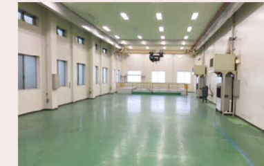
大阪第二工場 倉庫候補スペース