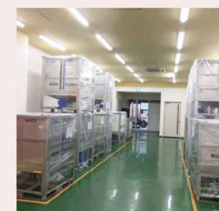
大阪第二工場パルク保管倉庫

安全を確保する上でもやはり荷物スペースの確保も必須となりますが、大阪工場より100m程離れた大阪第二倉庫に定温保管(パルク保管)や残資材保管を行い、さらに現在新たに倉庫増大を計画しております。