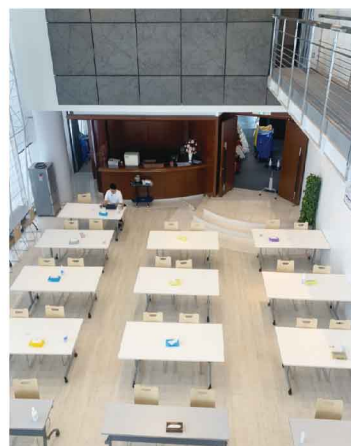
10階から見たホールの全体像

まずは9階。こちらは大ホールになっていて、普段は食堂兼打ち合わせスペースになっています。また各イベントホールとしても使用します。朝、始業開始までの時間を過ごしたり、ランチを食べたり、午後の休憩時間に使用されています。コロナ禍の今はソーシャルディスタンスを守り、向かい合うことなく座るスタイルにしています。9階は吹き抜けになっているので、天井が高くとても明るく開放感のある空間になっています。