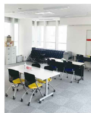
もう一部屋、打ち合わせスペースがあります。