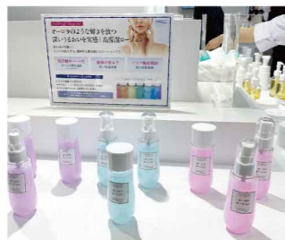
アイデアコンテストからの展示 オーロラーション

今回はwithコロナによる生活の変化やウイルス対策をはじめ使って納得していただける目新しい商品を発信していくために「衛生・効果実感・機能化粧品」をテーマとして展示いたしました。展示品はウイルス対策とした衛生商材8アイテム、マスク生活のお供となる商材3アイテム、アイデアコンテストから選ばれた17アイテム、そして新医薬部外品12アイテムと、昨年度よりも多く幅広いアイテムを展示。また、コロナ対策として1人でも多くのお客様に立ち寄っていた