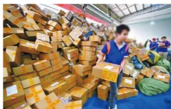
化粧品キャンペーン後の出荷の様子

会社NPDグループのデータによると、2020年12月までの12ヶ月で中国のEC美容市場だけでも649.01億元(約1兆500億円)に達し、世界最大のスキンケア製品市場となっています。コロナの衝撃と圧力の下で、中国の化粧品の小売と美容化粧品、ヘア・フェイス・ボディケア用品の輸入総額も急速な成長を維持しており、業界の繁栄は回復し続けています。2020年の中国化粧品の小売売上年間実績は3400億元を達成し、昨年同期比9.5%と大きく増加しました。中国住民一人当たりの可処分所得の増加に伴い、中国の化粧品市場はさらに大きくなる可能性があることが想像でき、この可能性は中国の化粧品産業の継続的な発展を支える原動力にもなります。