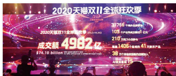
2020.11.11_1111 Shopping Carnival

一方で、コロナ禍で却って消費のデジタル化変革と産業のデジタル化アップグレードもできました。2020年、インターネット経済を代表としての新たな経済発展産業が強