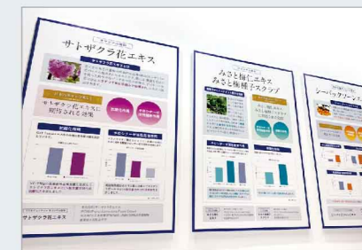
2021化粧品開発展で紹介しました