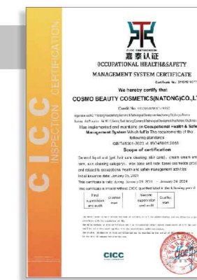
【ISO45001】健康安全管理体系-2021