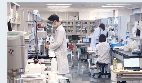
東京研究プラッテ

それぞれの個性を保ちながら一見派手なイメージを持たれがちな新規処方研究開発ですが、実は日々の