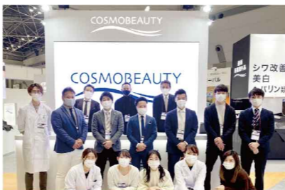
参加メンバー(東京営業部・東京研究部)

だけのようにソーシャルディスタンスを意識し、開放感のあるブースデザインにしました。さらに、各展示台には消毒液を置くことで展示物に安心して触れていただくように配慮しました。今回の化粧品開発展はコロナの影響により、昨年に比べて全体の来場者数は減っておりましたが、当社ではコロナ対策を徹底したことにより、他社のブースと比較しても多くのお客様に足を止めていただくことができました。そのため、様々な商材を実際に使用していただくことができ、サンプル依頼の問い合わせが殺到し、当社スタッフ全員の手が空いていない状況がありました。