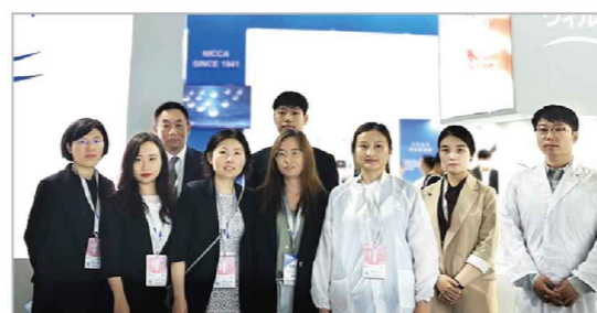
【展示会参加メンバー】