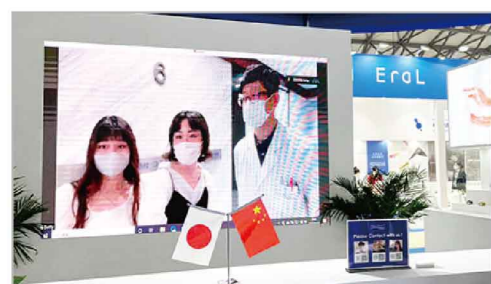
ライブ配信では、海外営業部に所属している二人がライブの司会者をし、大阪の研究所について詳しく紹介。

今年で連続5年間出展となり、3日間でチャットに追加された顧客の合計数は150社(新規)、400人を超えました。今回展示した中では、保湿ローション、クレンジング製剤(ウォーター、ミルク、バーム)、ボディスクラブ&ミルクなどが非常に人気があり、問い合わせを多くいただいております。