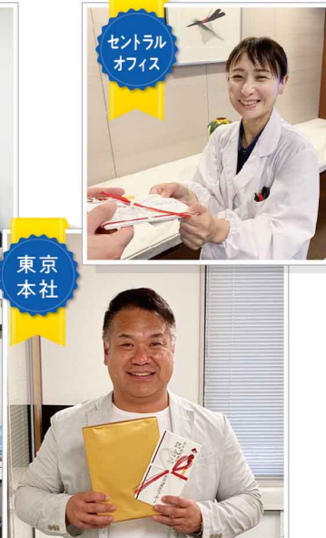
セントラルオフィス