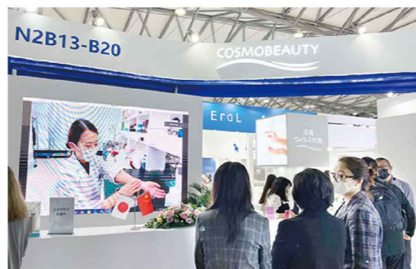
研究室での試作風景もライブ配信

今年度は日本の研究員、営業メンバーは現場に参加することができず非常に残念でしたが、ライブ配信を通じ当社の優れた研究チームや開発成果を紹介でき、来場者の皆様にリアルな魅力点を伝えることができたと考えております。今回の展示会での成果に基づいて、より一層お客様に喜んでいただけるよう、海外営業チーム一丸で取り組んで参ります。