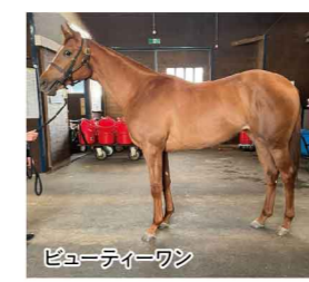
ビューティーワン