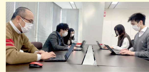
朝の定例ミーティング風景

その他にはお客様の自社商品の弱みや今後挑戦したい分野などを聞き取り、そのお客様に合った商品提案することも多く商談の中でアイデアを出し合ったり、時には研究の方にご協力頂ながらお客様のニーズでできるだけ合わせて商品づくりをする形の提案型の営業となります。そのため、自社商品販売する営業さんとは違いたくさんの商品とふれあい、柔軟な発想、他との差別化が重要になります。