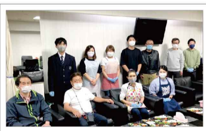
ボランティアの皆さんにお手伝いいただいています。