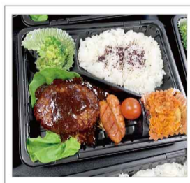
毎回テイクアウトのお弁当を準備します！