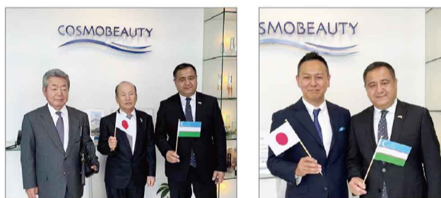
写真左：左から兵庫県湾岸開発山田社長、当社西川会長、駐日ウズベキスタン大使館の特命全権大使ムクシンジャ アブドゥラフモノフ閣下 写真右：山田社長とムクシンジャ アブドゥラフモノフ閣下

2022年4月14日(木)、駐日ウズベキスタン大使館の特命全権大使ムクシンジャ アブドゥラフモノフ閣下御一行様が当社にご来訪され、大阪工場を視察されました。大阪で開催されるウズベキスタン経済セミナーで講演される予定で来阪され、今後のウズベキスタンでの日本製品や日