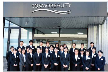
大阪工場・セントラルオフィス新入社員

した後、5月9日より各部署へ配属となります。初めは戸惑うこともたくさんあるかと思いますが、これからコスモビューティーの一員として、いろいろな多くのことに挑戦・経験し、頑張ってください！