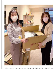
左：にしのみやこども食堂の大学生のボランティアスタッフ

「子ども食堂」は、ほとんどが寄付や開催者の自己負担によって成り立っているため、継続的な開催が難しい点が問題です。その課題を解決する最初の取り組みとして、コスモビューティーは兵庫県・大阪府の「こども食堂」を支援していきます。