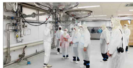
工場内をご視察(製造・充填)

2022年4月14日(木)、駐日ウズベキスタン大使館の特命全権大使ムクシンジャ アブドゥラフモノフ閣下御一行様が当社にご来訪され、大阪工場を視察されました。大阪で開催されるウズベキスタン経済セミナーで講演される予定で来阪され、今後のウズベキスタンでの日本製品や日