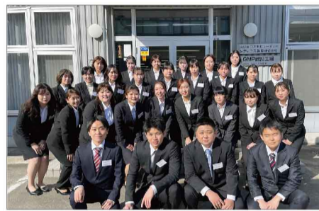
関東工場・東京本社新入社員

新入社員の皆さんはまさか初日にテストがあると思っていなかったようで、びっくりした人もいたようですが、高得点を取られていた方も多数いらっしゃいました。土日を含み4月4日からは1か月かけて工場での現場研修を行い、GW休暇でリフレッシュ