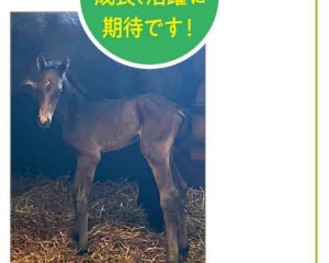
ヒロシゲサファイヤ2023