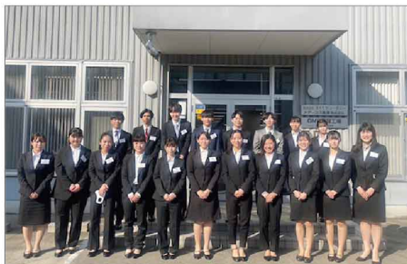
関東工場・東京本社新入社員

また今年は、神戸工場の新入社員もセントラルオフィスで入社式に出席しました。そのため夕方から神戸工場配属社員及び翌日から神戸工場で研修が始まるセントラルオフィス配属の新入社員の一部が神戸工場へ向けて移動をするという忙しい1日でした。