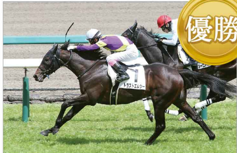
トラストエムシー