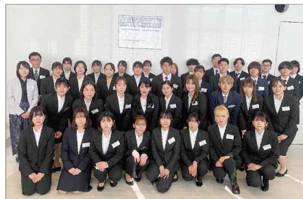
大阪工場・神戸工場・大阪技術センター・セントラルオフィス新入社員

毎年入社式を担当させていただき、新入社員を初日に迎えられることができるというのは、非常に貴重な経験です。入社式の日とは新たな年度のスタートでもあります。今後のコスモビューティーの発展をしっかりと支えることができるよう頑張りたいと決意を新たにしました。