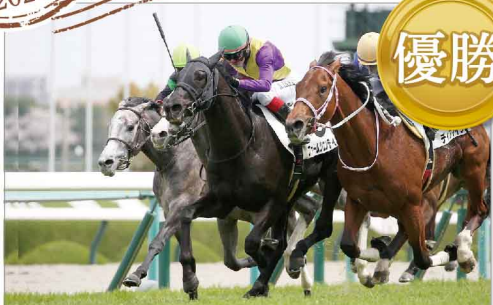
ファームツエンティ