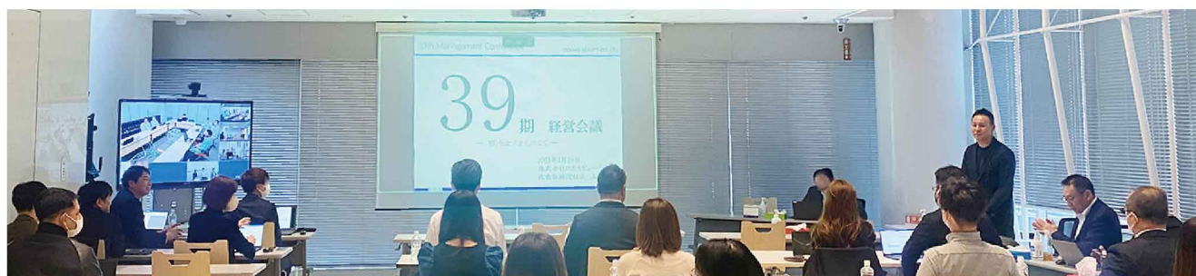
セントラルオフィス9階での会議の様子。各拠点とはTV会議で繋いで開催。