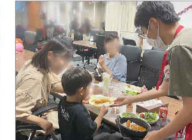
第4土曜日は施設内での会食スタイル