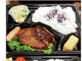
第2土曜日はお弁当テイクアウト

芦屋市大原町の当社福祉厚生施設内に第2・第4土曜日子ども食堂を開催しております。第2土曜日はお弁当テイクアウト、第4土曜日は施設内での会食形式をとっております。会食形式は今年3月から開始しましたが、初回から数組の親子が来店されたいへん賑わいました。会食の回は芦屋学園の先生、生徒さんがボランティアで来てくださり、風船やお絵描き、ボールなどで子どもたちと遊んでくれます。これからも、子どもたちにおいしい食事と楽しい時間を提供していけるよう創意工夫して取り組んでまいります。