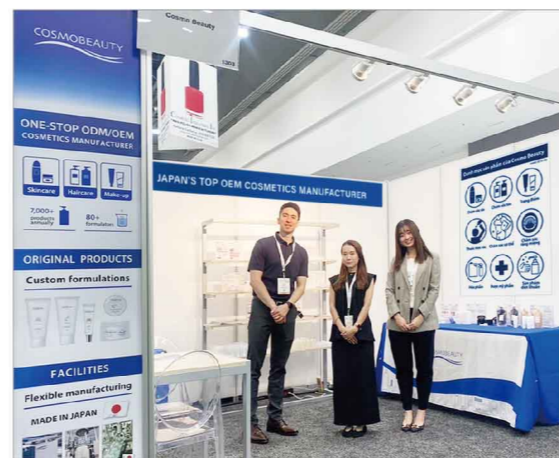
展示会参加メンバー。