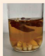
米酢にトウガラシとニンニクを漬けた自家製の虫よけ。

の自家農園の強みです。同じゴーヤでも未成熟と完熟のものでは含まれている成分が違って、肌への有効性に差のあるデータが取れるかもしれないそうです。コスモビューティーオリジナルの完熟ゴーヤエキス。これを配合した化粧品が近いうちに生まれることを期待しています。(関東研究部:村上幸晴)