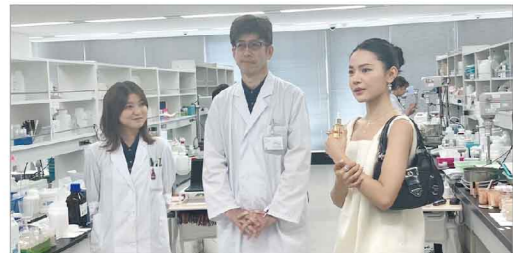
研究室の見学でも熱心に質問されていました。

8月25日と9月4日に中国からKOLの方が来社されました。当社で生産させていただいている商品の知識を深めるため、研究所と工場見学が目的です。研究所では熱心に研究員に説明を求めています。