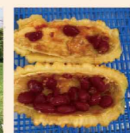
半分に割ると中のタネまで完熟。とっても甘い匂いがします。