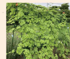
ゴーヤのカーテンです。

虫よけをスプレーするとこれが抜群に効果を発揮したのか、その後はぐんぐんと成長し梅雨明けの頃から収穫できるようになりました。完熟ゴーヤはとても柔らかく、放っておくとすぐに溶けてしまうので店頭と並ぶことはまずありません。こういうエキス素材を作れ