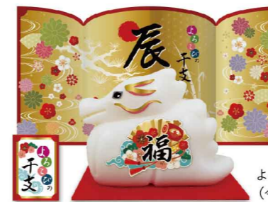
よるこびの干支(令和六年辰)

令和六年の干支石鹸は、勇ましあふれる龍の形状となりました。屏風に華描きの松や竹をあしらひ、龍の猛々しさを表現しつつお正月らしい色が出るように華やかさも演出しています。