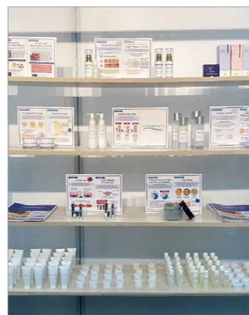
アイデアコンテスト処方の開発品