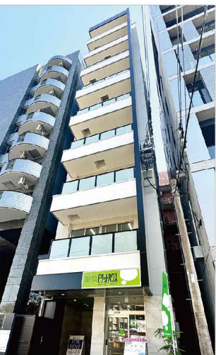
オフィスは博多駅から徒歩8分、祇園駅から徒歩5分とアクセスが便利