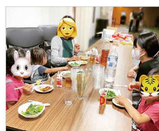
室内子ども食堂(イトイ)