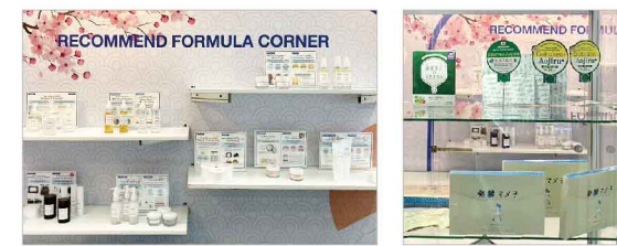
アイデアコンテストからの処方展示