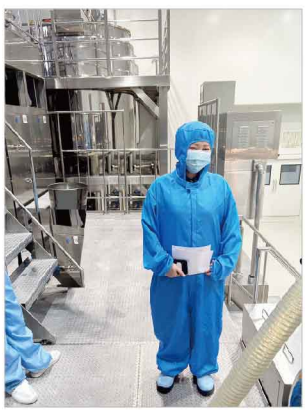
製造立ち合い現場にて

また、ちょうど滞在先のホテルの近くにお得意先様の路面店があり、訪問して美容部員の方々と話す機会がありました。「高校を卒業してからこの会社に勤め、商品を愛用している。商品のすばらしさを実感しているのもっと色々なお客様に伝えたい」との声を聞き、日本で開発した商品が中国国内で愛用されている事に感慨深いものを感じました。