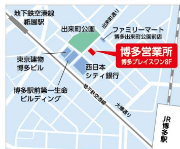
【住所】〒812-0011 福岡県福岡市博多区博多駅前1丁目11-14 博多プレイスワン8F