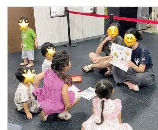
大人の絵本の時間