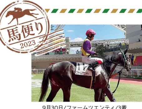
9月30日/ファームツエンティ3着