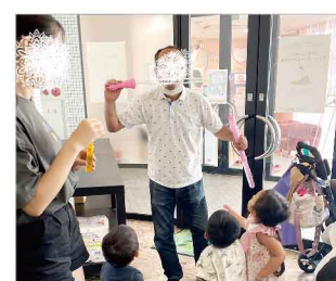
巨大シャボン玉に大喜び

芦屋市社会福祉協議会の広報活動やSNSなどからボランティアの問い合わせが増えてきました。芦屋学園の高校生と、10月からは神戸学院大学栄養学部が定期的に参加してくれることになり、とても助かります。子どもたちもお兄さんお姉さんと遊ぶことを楽しみにしています。