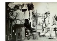
『わが道』撮影ロケ現場 右:新藤監督

コスメビューティーはチャイケモハウスの活動を応援・サポートしています。チャイケモハウスは神戸市中央区のポータラランドに集積する高度医療機関に治療を受けに来られる小児がんなど小児慢性疾患のお子さんとうい、家族が滞在できる施設です。