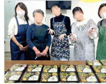
ボランティアのみなさん

昨年12月から、芦屋川カレッジ38期生の方々ボランティアとして活動してくださっています。毎月、お弁当作りの回に3~4名で参加してくれていますが、さすがの先輩方。役割分担をしっかりとこなし、テキパキとした対応で助けてくれています。また、多世代間交流も行われており、有意義なひとときとなっています。