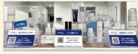
ショールームにQRコードを設置しています

博多営業所は非常に博多駅から近いこともあり、お客様の来社が非常に多いのが特徴です。その為、ショールームでは提案処方の見える化計画を進めております。提案案にQRコードを付け処方や使用方法の動画や商品特徴をわかりやすく見ていただけるように随時更新しています。定期的にご来社いただき、常に新しい発見をしていただ