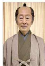
※いま撮影中の大奥一何の役でしょう?!

コスモビューティーはチャイケモハウスの活動を応援・サポートしています。チャイケモハウスは神戸市中央区のポートアイランドに集積する高度医療機関に治療を受けに来られる小児がんなど小児慢性疾患のお子さんやご家族が滞在できる施設です。