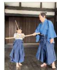
「刺客商売」杉原左内役