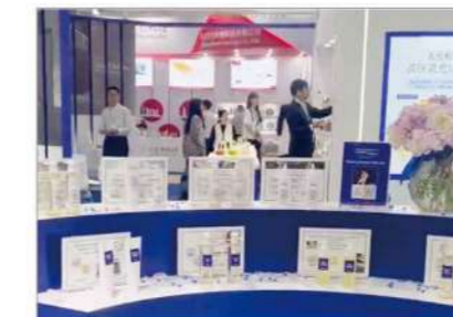
アイコン・医薬部外品など30点以上を展示