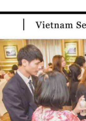
プレゼントも熱心にサンプルを確認する参加者のみなさん

会場全体の雰囲気は日本の展示会と似ていますが、規模がとて大きく、1Fと2Fにわたる広大なフロアに各社ブースが割り振られていました。各社のブースは日本と比べて非常に華やかで個性あふれるデザインが多い印象を持ちました。展示されているものは原料のみならず、タブレット製剤機も展示されており、タブレット製剤機によるタブレット製剤の実演も行われていました。おもしろいと思っていた所に少しづつ植物性でも遜色ないレベルまで近づけている所にEU原料メーカーの進歩を感じました。今回は素晴らしい展示会への参加をさせていただき、ありがとうございました。知り得た情報は共有して会社全体の利益となるように努めたいと思います。