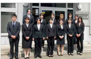
関東工場・東京本社新入社員